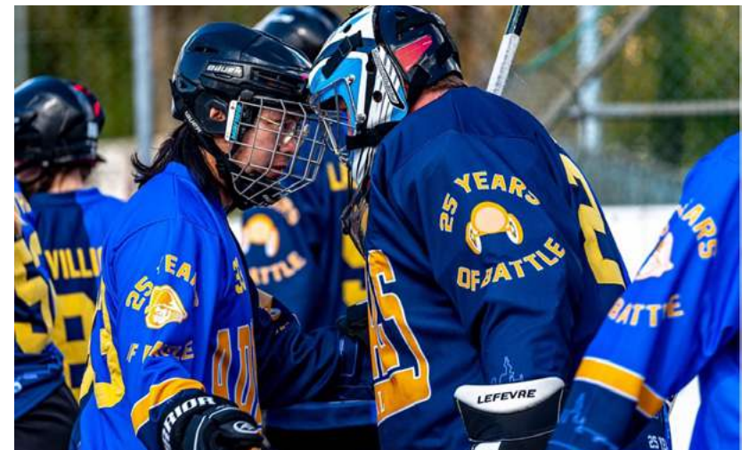
Einschwören vor dem Spiel.

Mit dem neuen Trainerstaff, bestehend aus Headcoach Björn Bürgi und Assistenzcoach Patric Lüscher, werden wir auch auf Trainings- und Coachingebene gewisse Kontinuität fördern. Ziel ist es, in der nächsten Saison die Playoffs zu erreichen und die neueren Spieler*innen weiterzubringen und ihnen Sicherheit zu vermitteln; während die Routiniers zu Leistungsträgern werden.