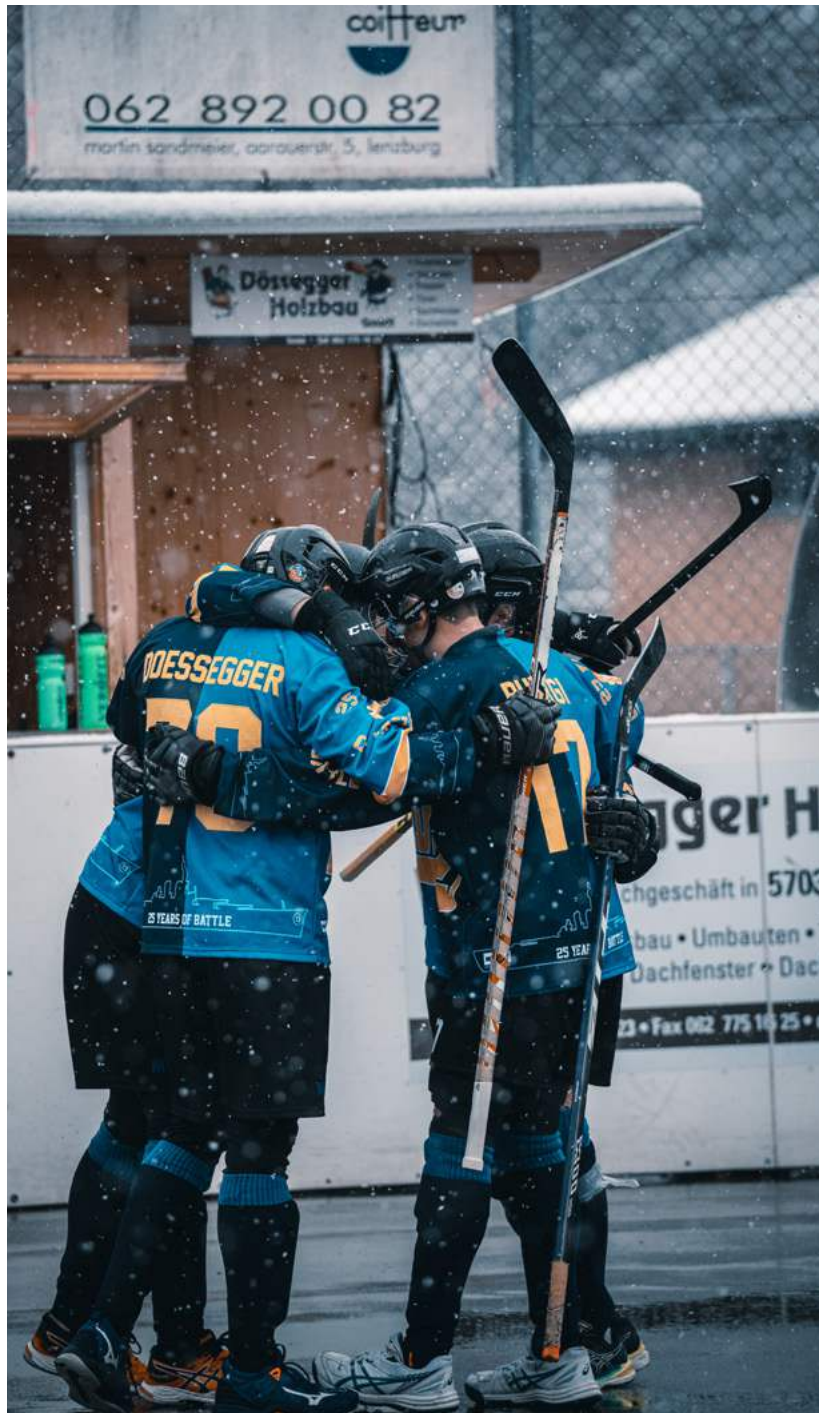
Hockey is family