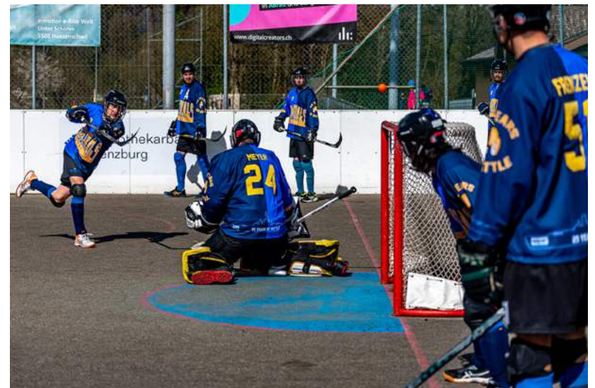
Einschiessen vor dem Spiel.