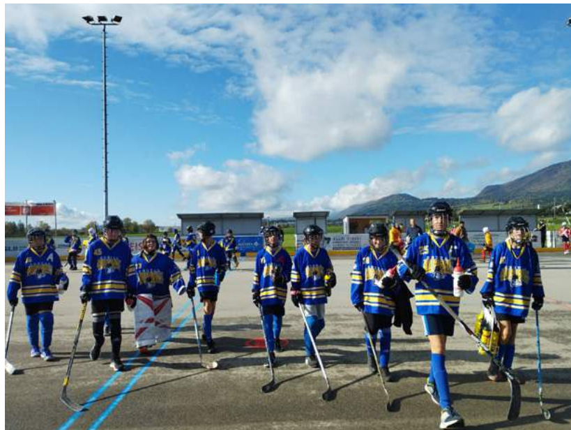
Das Team am ersten Turnier.