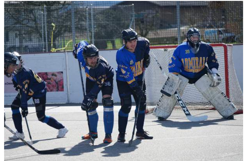
Volle Konzentration beim Bully.