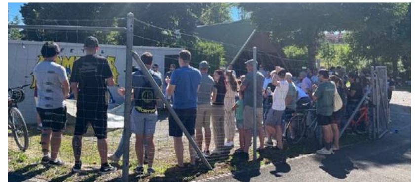
Zahlreiche Besuchende feierten das 25-jährige Jubiläum des Vereins.

Nebst all dem wurde natürlich leckeres Essen und kühle Getränke genossen und vor allem die super Gemeinschaft zelebriert. Wir freuen uns auf weitere 25 Jahre mit euch allen.