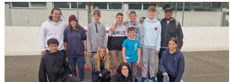
Juniorinnen und Junioren U15