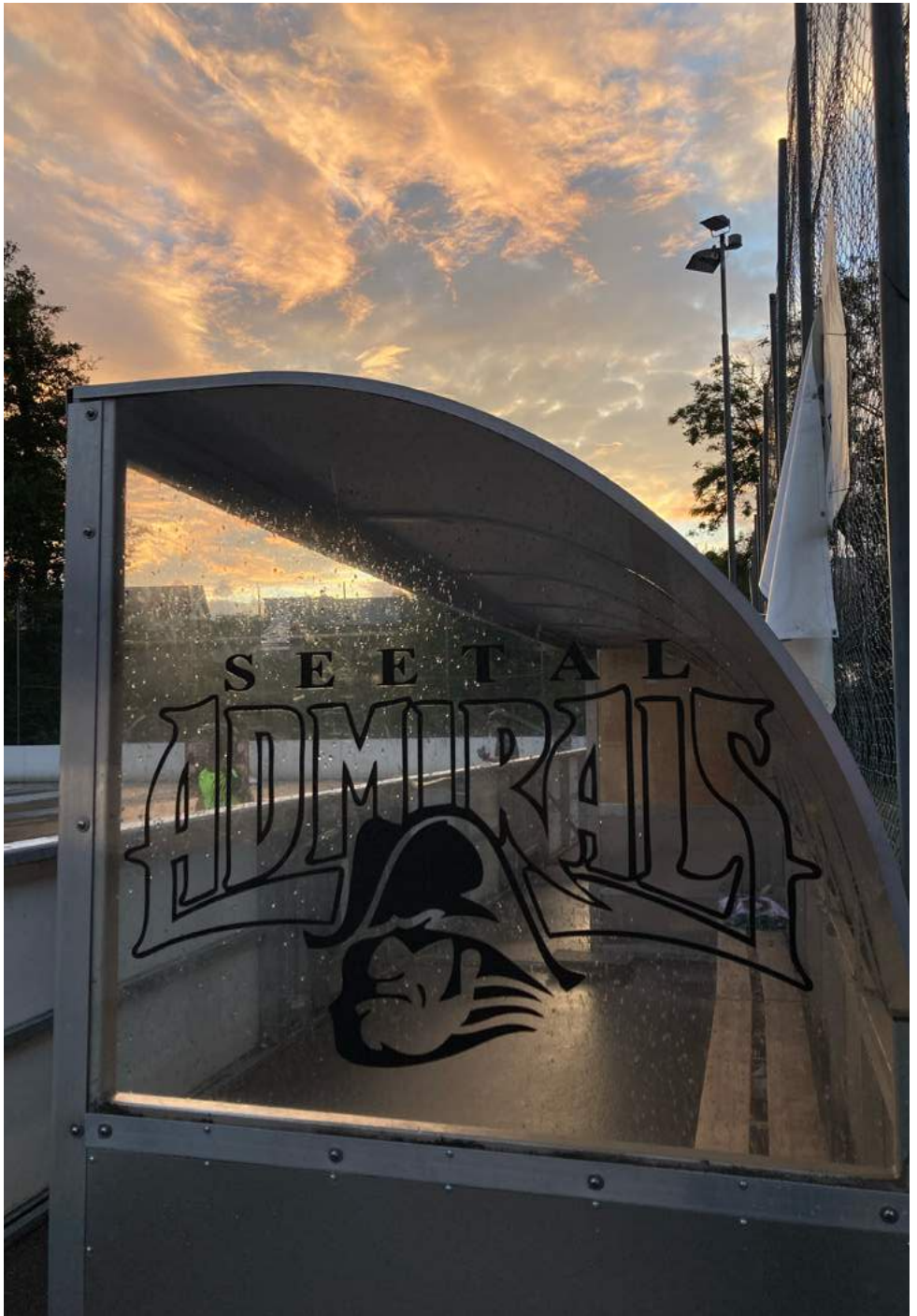
So schön kann ein Hockeytraining sein!