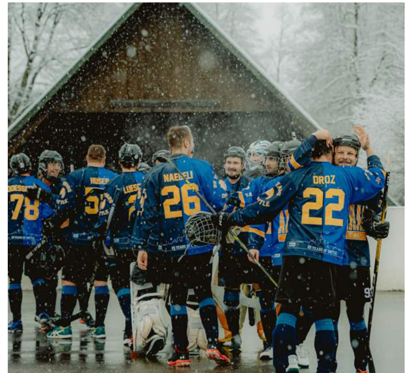
Lachende Gesichter trotz hoher Cup-Niederlage