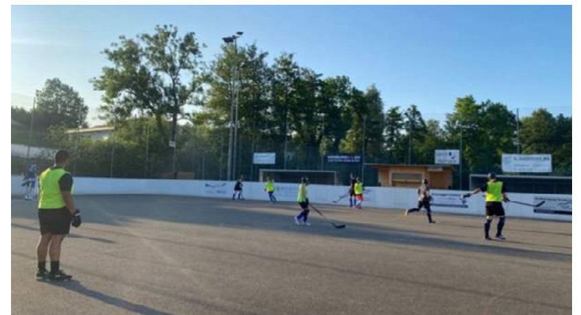
Gemeinsames Mätschle von den Junioren und einigen Aktiven

Topscorer I - * Rang vereinsintern / Liga